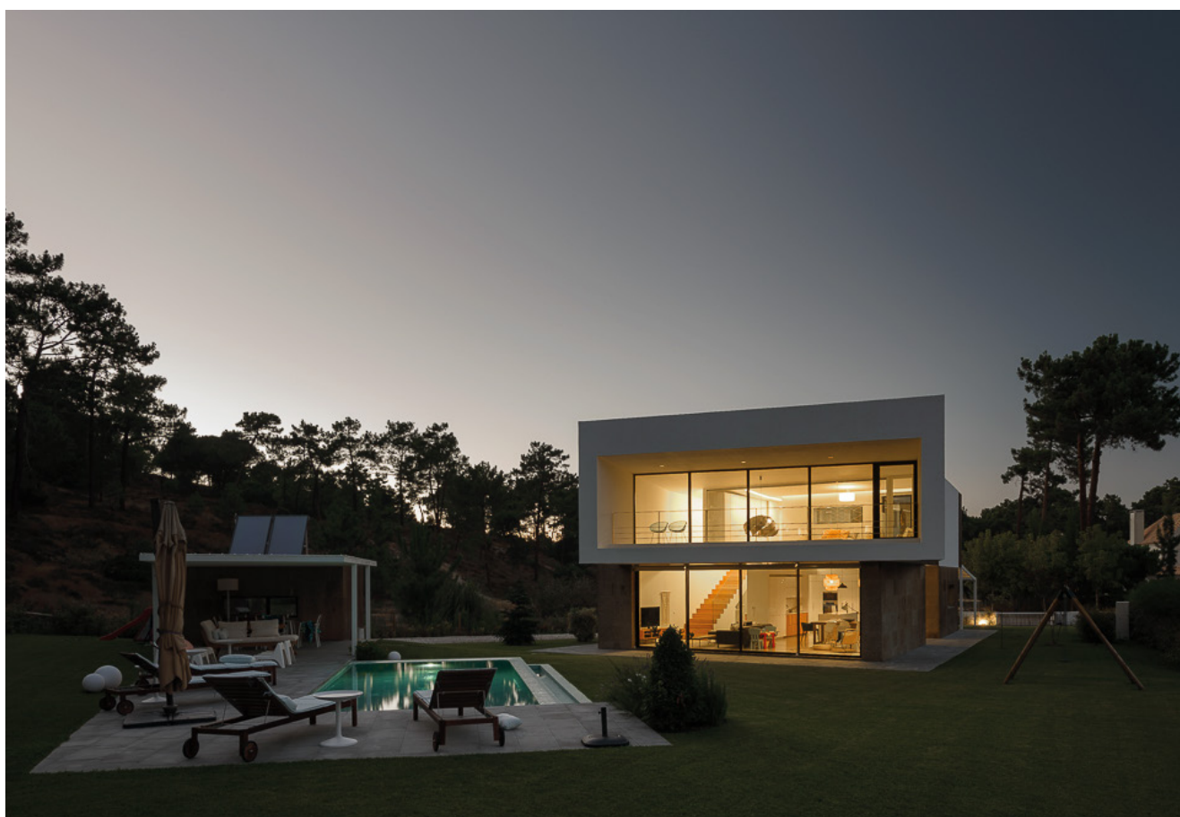
CASA DA AROEIRA Luís Monteiro Arquitectos Aroeira, Almada