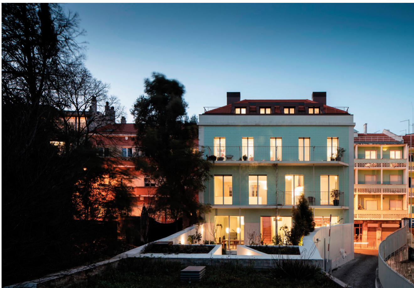
CASA N.º 11 — SANTA ISABEL Camrim Arquitectos Lisboa, Portugal

Arquitectura: Camrim Arquitectos